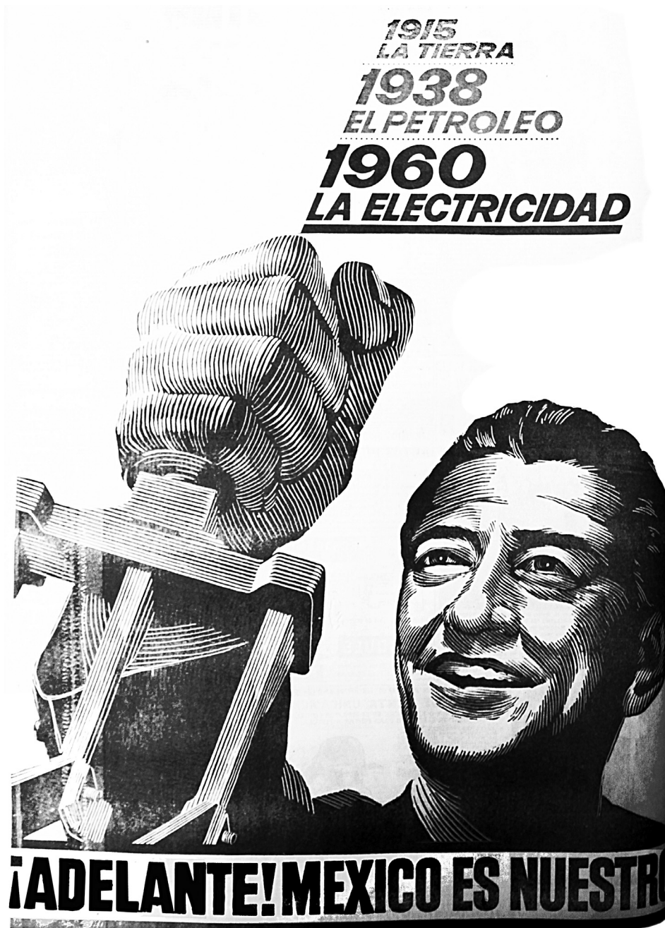
Imagen 10a. El presidente del gobierno como encarnación última de la nación y de sus destinos, El Universal , 3 de septiembre de 1960.