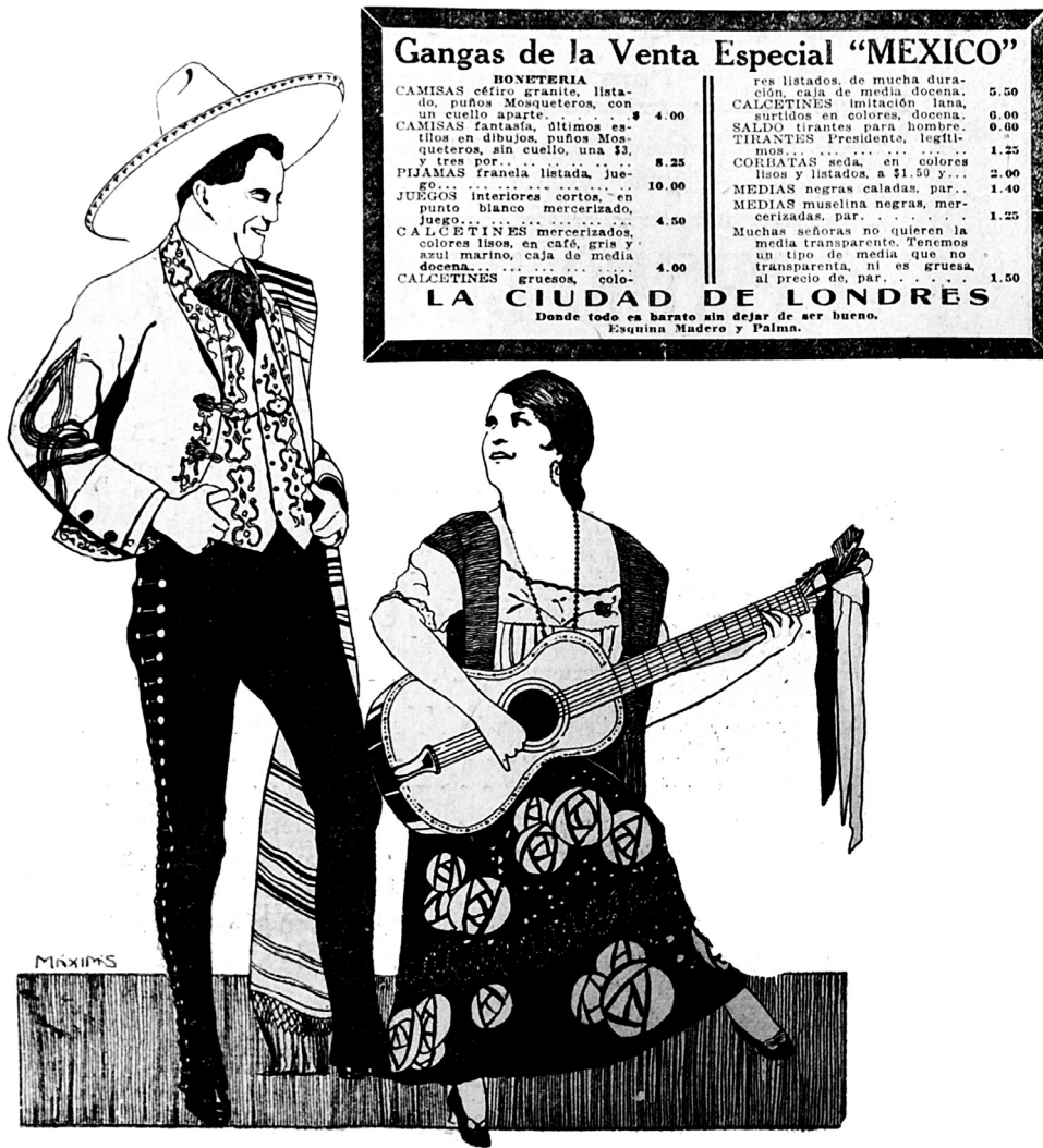
Imagen 5b. Las nuevas formas del nacionalismo posrevolucionario. El Universal , 22 de septiembre de 1921.