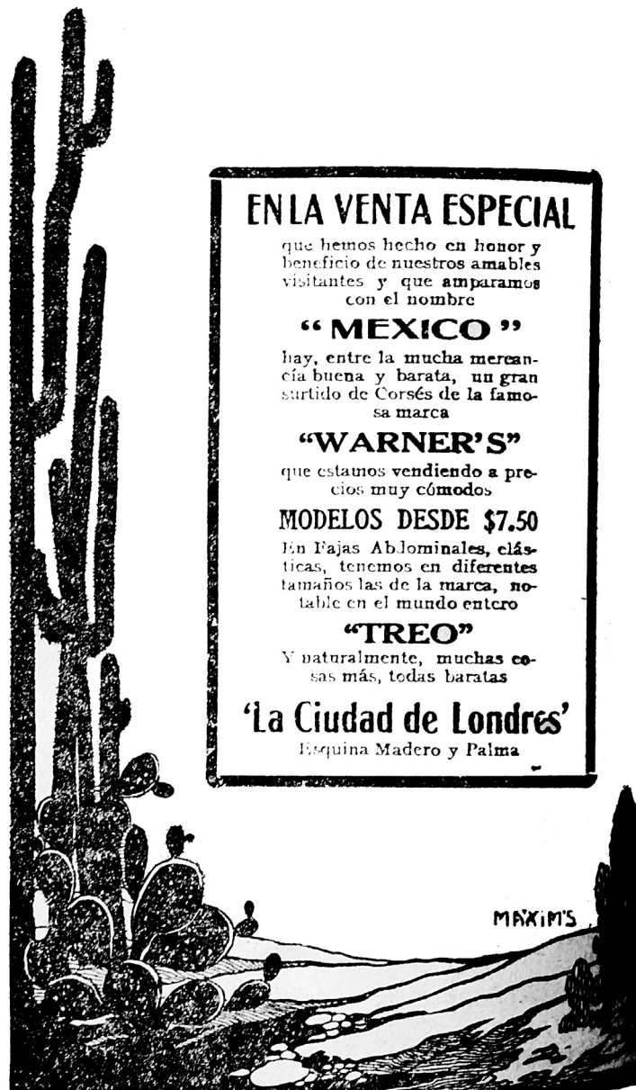
Imagen 5a. Las nuevas formas del nacionalismo posrevolucionario, El Universal , 21 de septiembre de 1921.