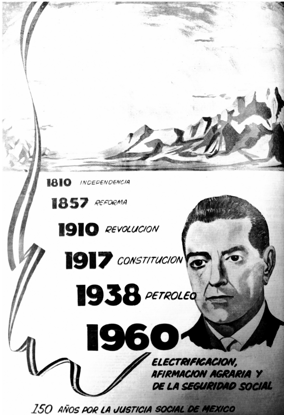
Imagen 10c. El presidente de gobierno como encarnación última de la nación y de sus destinos, El Universal , 3 de septiembre de 1960.