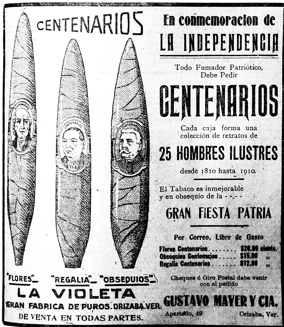
Imagen 3. Justificación histórica de la nación, El País , 2 de septiembre de 1910.