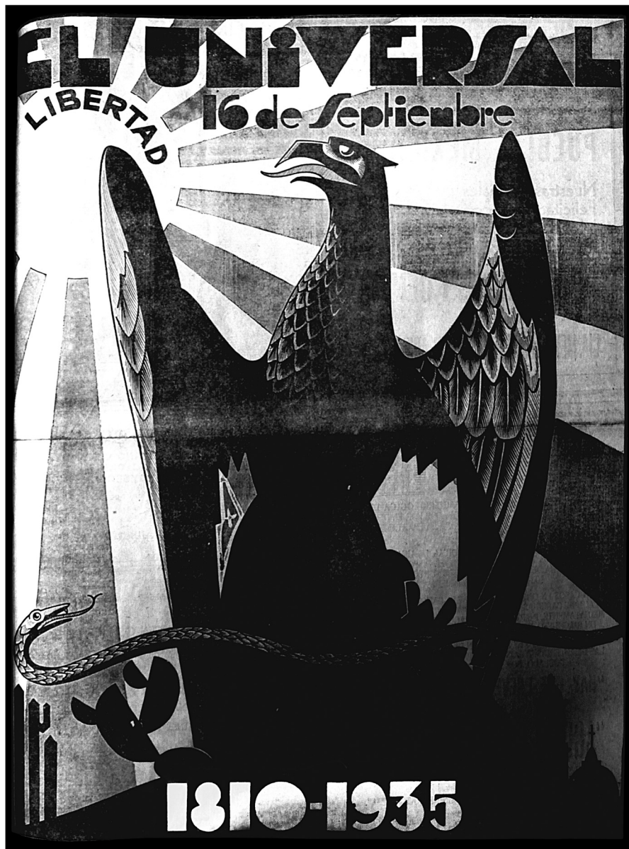
Imagen 7. Elementos del escudo de México en la “tarjeta” de felicitación del periódico, El Universal , 16 de septiembre de 1935.