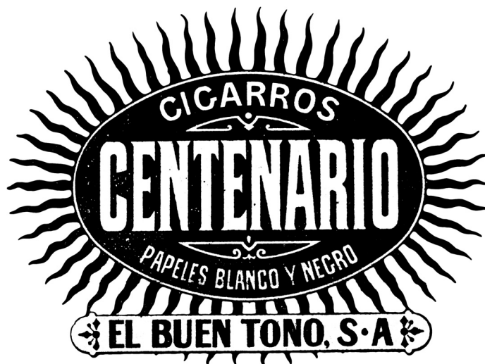
Imagen 2. Alusión guadalupana del nacionalismo mexicano, El Imparcial , 6 de septiembre de 1910.

componente del nacionalismo mexicano, aunque fuera del discurso oficial –debido a la necesidad de laicidad que imponía el liberalismo–, tenía también una larga historia, pues ya durante la época colonial se había empleado como argumento reivindicativo de una identidad novohispana, diferente de la española peninsular y, por tanto, legitimadora de una mayor autonomía. Durante los años de la guerra de Independencia, al convertirse en una de las imágenes con las que se llamó a la insurgencia, el símbolo claramente se politizó y se identificó con la idea del México independiente; idea que quedaría reforzada unas décadas más tarde, tras su coronación en 1895. 26