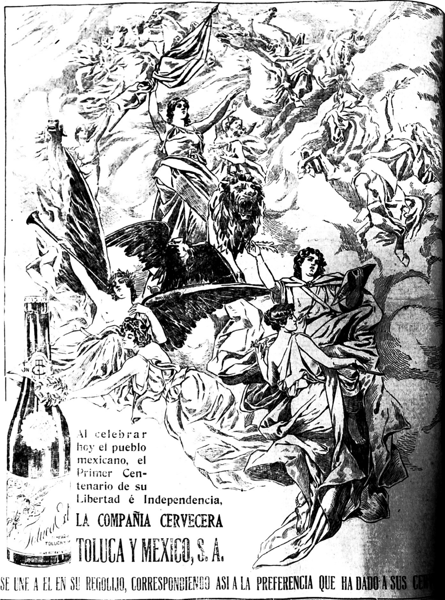
Imagen 1. La nación como representación alegórica, El Imparcial , 16 de septiembre de 1910.