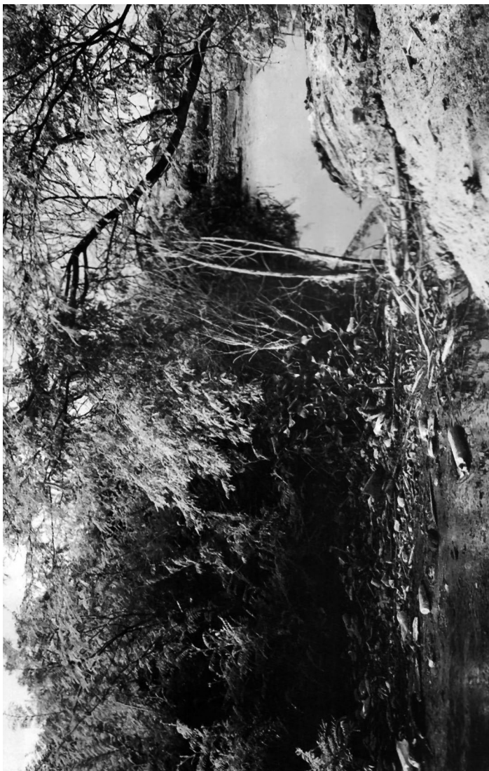
Imagen 5: Basura tirada al río São Francisco-Petrolina (Pernambuco). En Zinclar, Sant'Anna (2005).