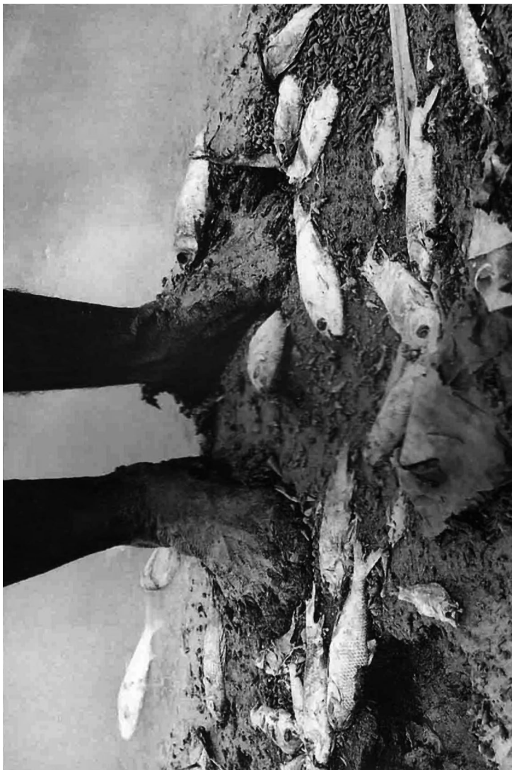
Imagen 4: Contaminación en la cuenca del río São Francisco. Mortandad de peces en lago entre Petrolina y Lagoa Grande (Permambuco). En Zinclar, Sant'Anna (2005).