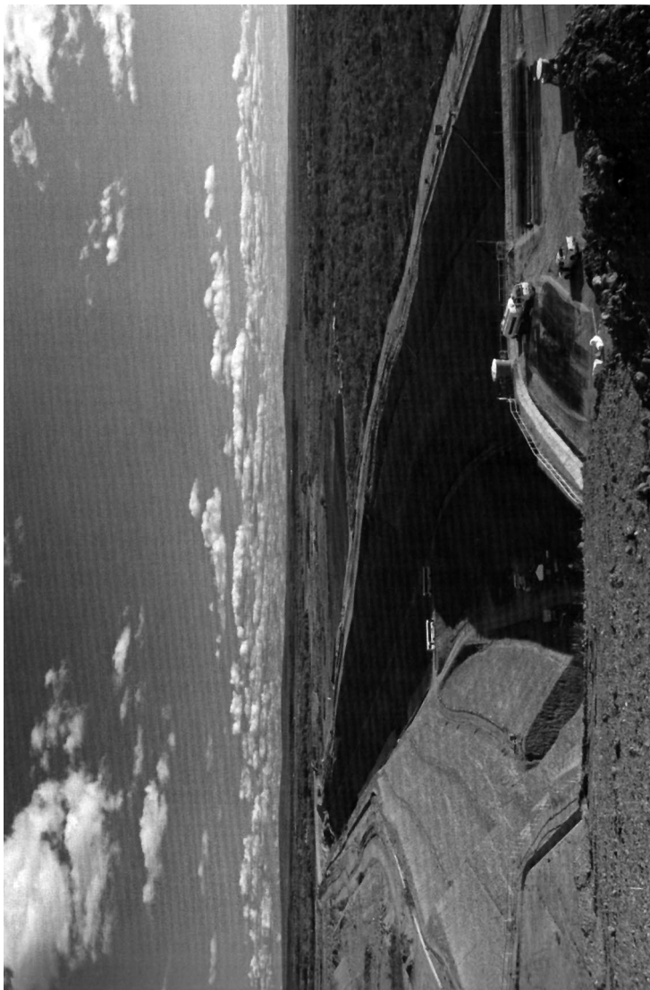
Imagen 2: Canal del eje Este en construcción, cerca del Reservatorio de Itaparica, en el río São Francisco.