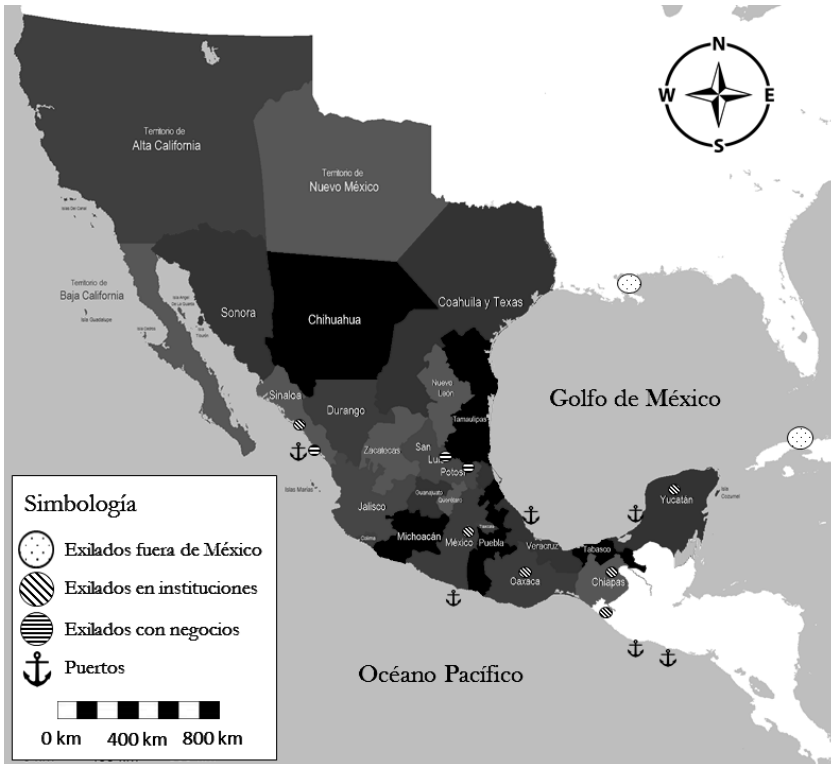
Mapa 1. Geografía humana del primer exilio federal centroamericano (1829-1840)