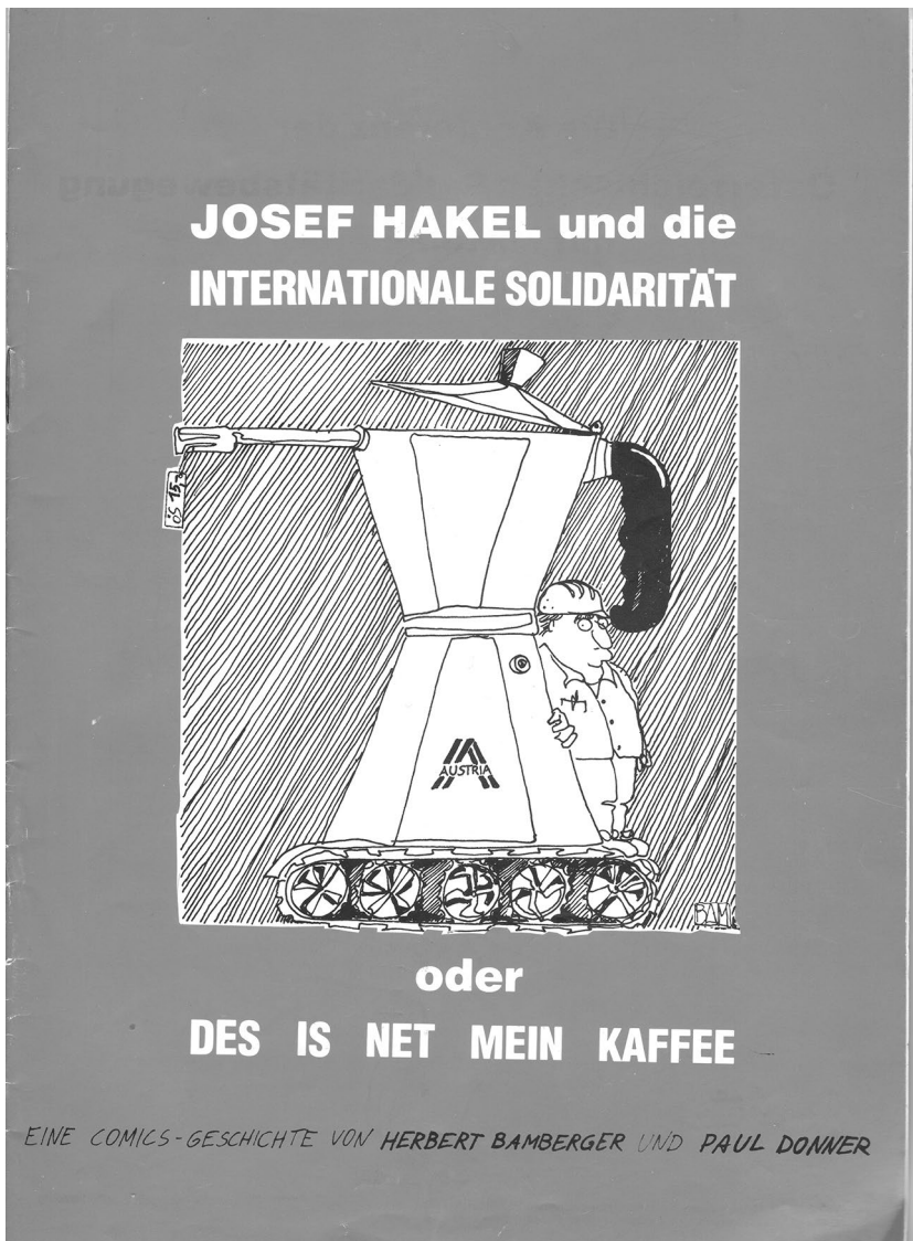
Imagen 2. Josef Hakel y la solidaridad internacional o “Eso no es mi café”*

* “Nicht mein Kaffee (No es mi café)” es una expresión coloquial austriaca para señalar que algo no es asunto de uno.