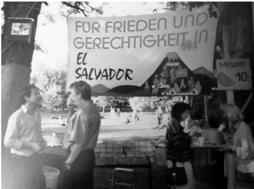
Imagen 3. Por la paz y la justicia en El Salvador.

ridad se adaptaban a un nuevo horizonte de lo posible: contribuir por medio de proyectos al desarrollo, a “disminuir al menos un poco la injusticia”. 29