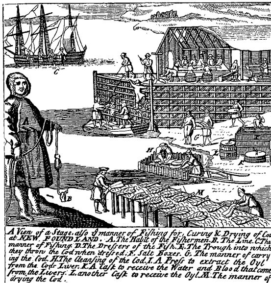
A View of a Stage, also of manner of Fishing for, Curing & Drying of Cod at NEW-FOUND-LAND. A. The Habit of the Fishermen. B. The Line. C. The manner of Fishing. D. The Dressers of the Fish. E. The Trough into which they throw the Cod when dressed. F. Salt Boxes. G. The manner of carrying the Cod. H. The cleansing of the Cod. I. A Press to extract the Oyl from the Cod Liver. K. A Trough to receive the Water and Blood that comes from the Liver. L. another Trough to receive the Oyl. M. The manner of drying the Cod.

diendo sus intereses y relaciones por la entidad, usufructuó potreros y ganado en diversos sitios, ubicados sobre todo hacia la costa del Golfo.