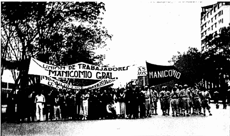
Manifestación de los trabajadores del manicomio en las calles de la ciudad de México, 1945.

Fondo Culhuacan, inv. 462150, © CONACULTA-INAH-SINAFO-FOTOTECA NACIONAL.