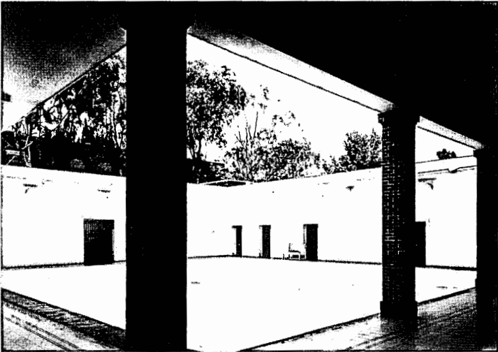
Patio del Pabellón de Agitados reconstruido, 1945.

Fondo Culhuacan, inv. 427765, © CONACULTA-INAH-SINAFO-FOTOTECA NACIONAL.