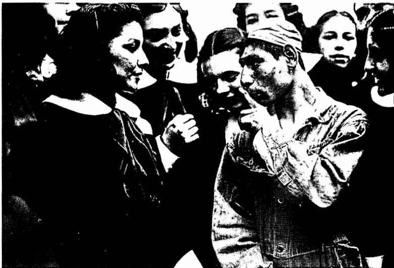
Interno conversando con jovencitas escolares de visita a La Castañeda, 1935.

Fondo Culhuacan, inv. 462150, © CONACULTA-INAH-SINAFO-FOTOTECA NACIONAL.