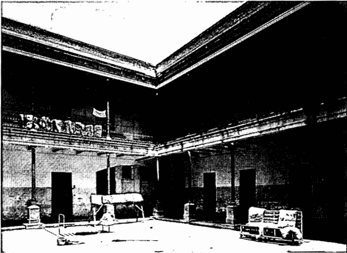
Estado ruinoso de algunos pabellones en el manicomio, 1945.

Fondo Culhuacan, inv. 427765, © CONACULTA-INAH-SINAFO-FOTOTECA NACIONAL.